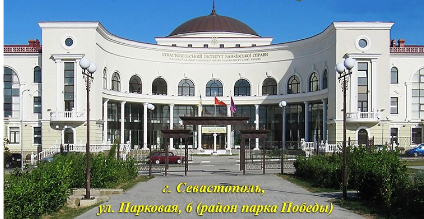
г. Севастополь, ул. Парковая, 6 (район парка Победы)

Севастопольский институт банковского дела Украинской академии банковского дела Национального банка Украины