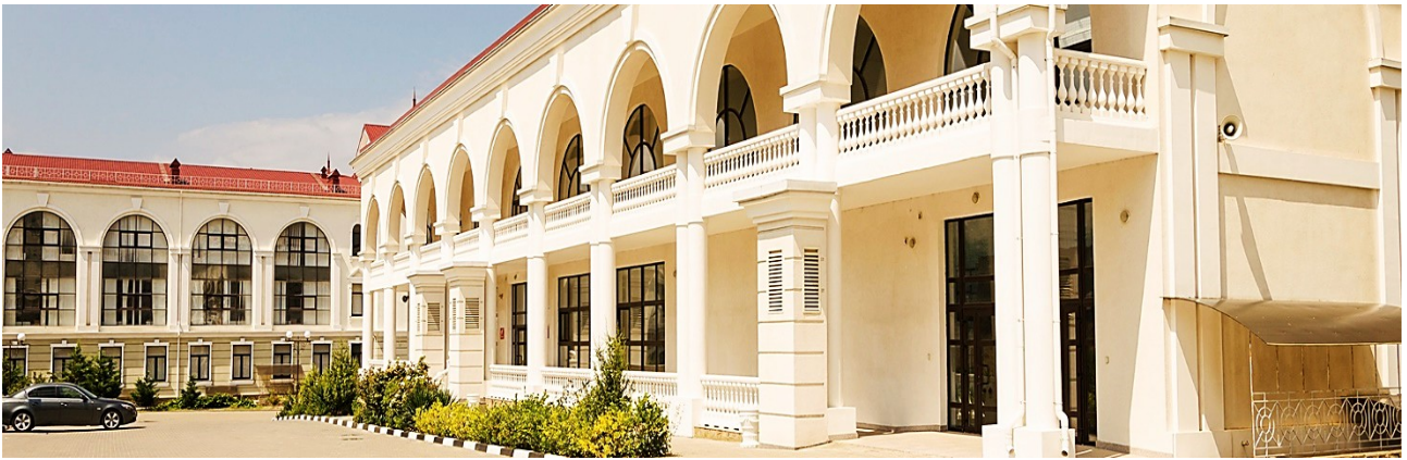
Спортивно-тренировочный комплекс. Открыт 18 февраля 2011 года