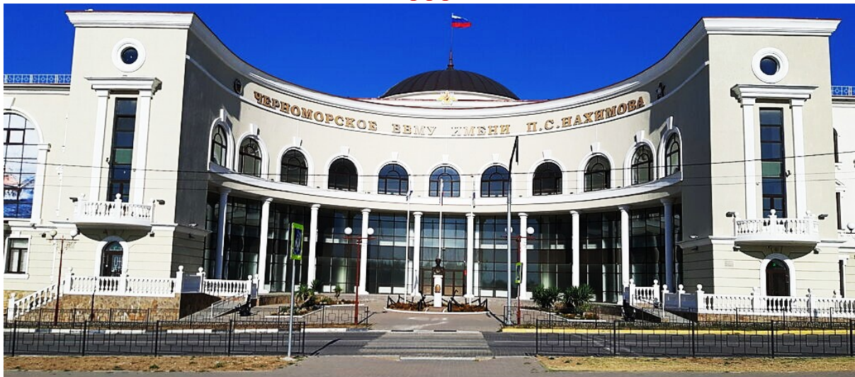
С 2016 года – Черноморское ВВМУ имени П.С. Нахимова