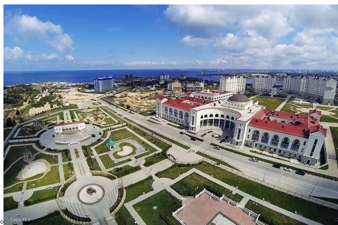
Вид на бывшую банковскую академию и студенческий парк с птичьего полёта

Озвучивая проект данного постановления, вице-губернатор Севастополя Илья Пономарёв напомнил, что 30 сентября 2016 года решением Центрального банка России имущество Московского банковского колледжа Центробанка РФ было передано в собственность Севастополя.