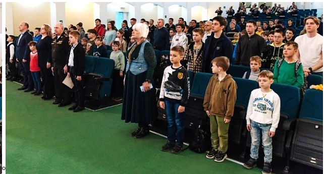
16.03.2024. На открытии шахматного турнира